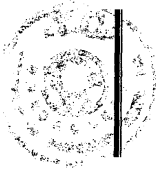
Sami GÜÇLÜ Minister of Agriculture and Rural Affairs

ON BEHALF OF THE GOVERNMENT OF THE REPUBLIC OF TURKEY