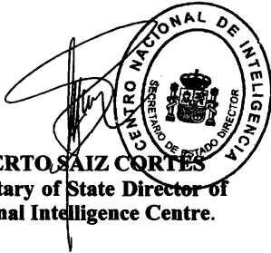
ALBERTO SAIZ CORTES Secretary of State Director of National Intelligence Centre.